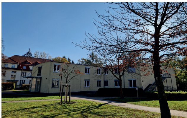
Haus B11 der Klinik für Kinder- und Jugendpsychiatrie