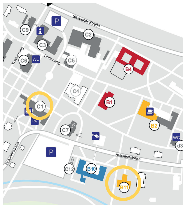
Lage der Therapiestation für Kinder- und Jugendliche (B11) und Ambulanz (C1)

Klinik für Kinder- und Jugendpsychiatrie und -psychotherapie